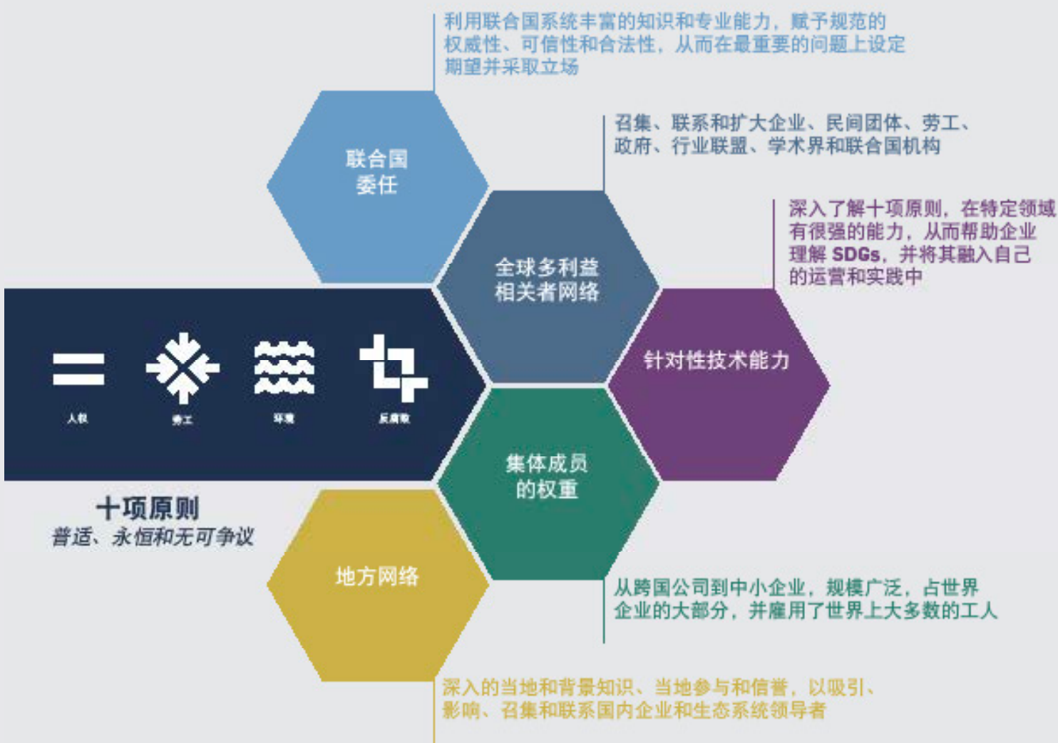
图 3：联合国全球契约组织为会员企业提供的独特价值来源