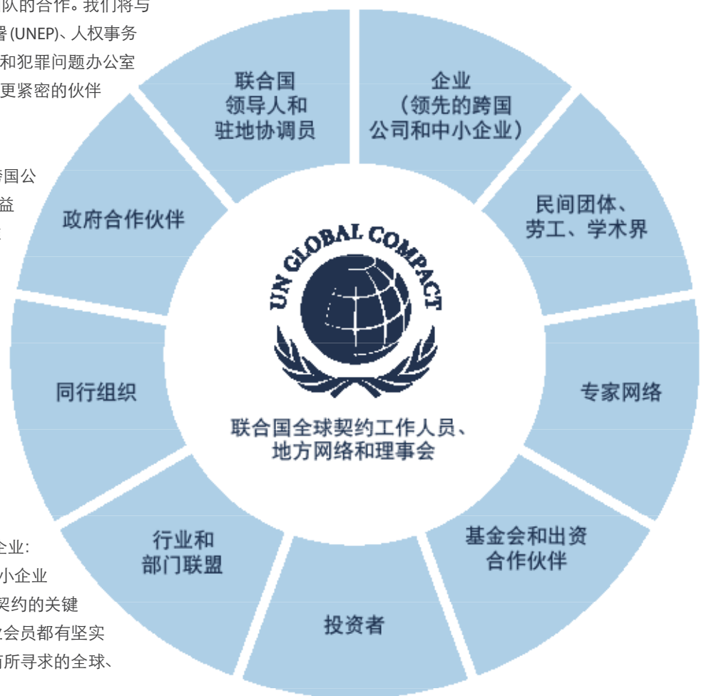
图2：联合国全球契约组织的主要利益相关者

我们的会员企业主要包括三种类型的企业：跨国公司 (MNC)、领先的国内公司和中小企业 (SME)。这些会员企业都是联合国全球契约的关键支持者，而且我们需要每种类型的企业会员都有坚实的代表性和参与力度，以确保我们拥有所寻求的全球集体和大规模影响力。