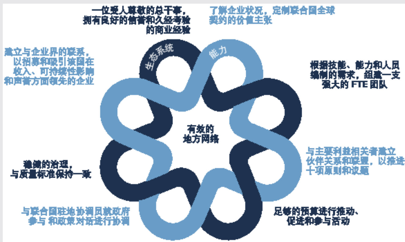
图 8：成功的地方网络 - 8 个要素

扩大联合国全球契约的覆盖面需要联合国全球契约办公室提供更多地组织支持。为了建立新的地方和区域网络，一个更新的和地区化的运营模式将有助于向全球契约会员企业有效地提供量身定制的内容。全球契约现有三个区域中心，分别位于非洲、中东和拉丁美洲。作为本策略的一部分，我们将增设两个区域中心，以确保我们的地方网络获得充分、有效的支援。