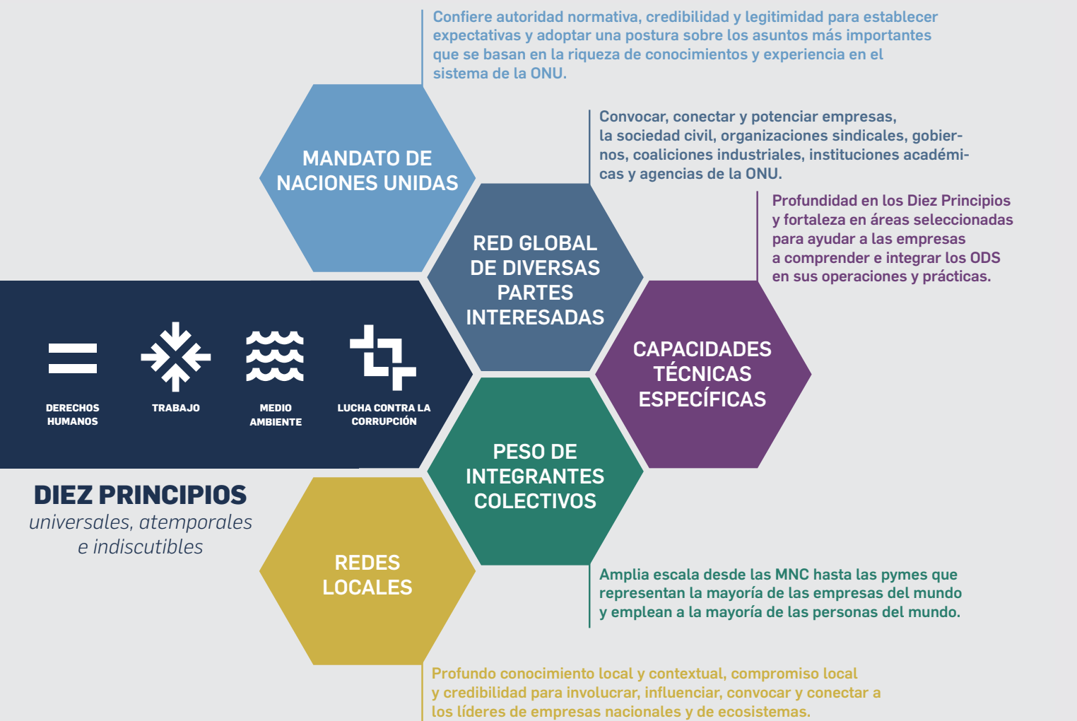
FIGURA 3: FUENTES DE VALOR ÚNICAS PARA LOS PARTICIPANTES DEL PACTO MUNDIAL DE LA ONU