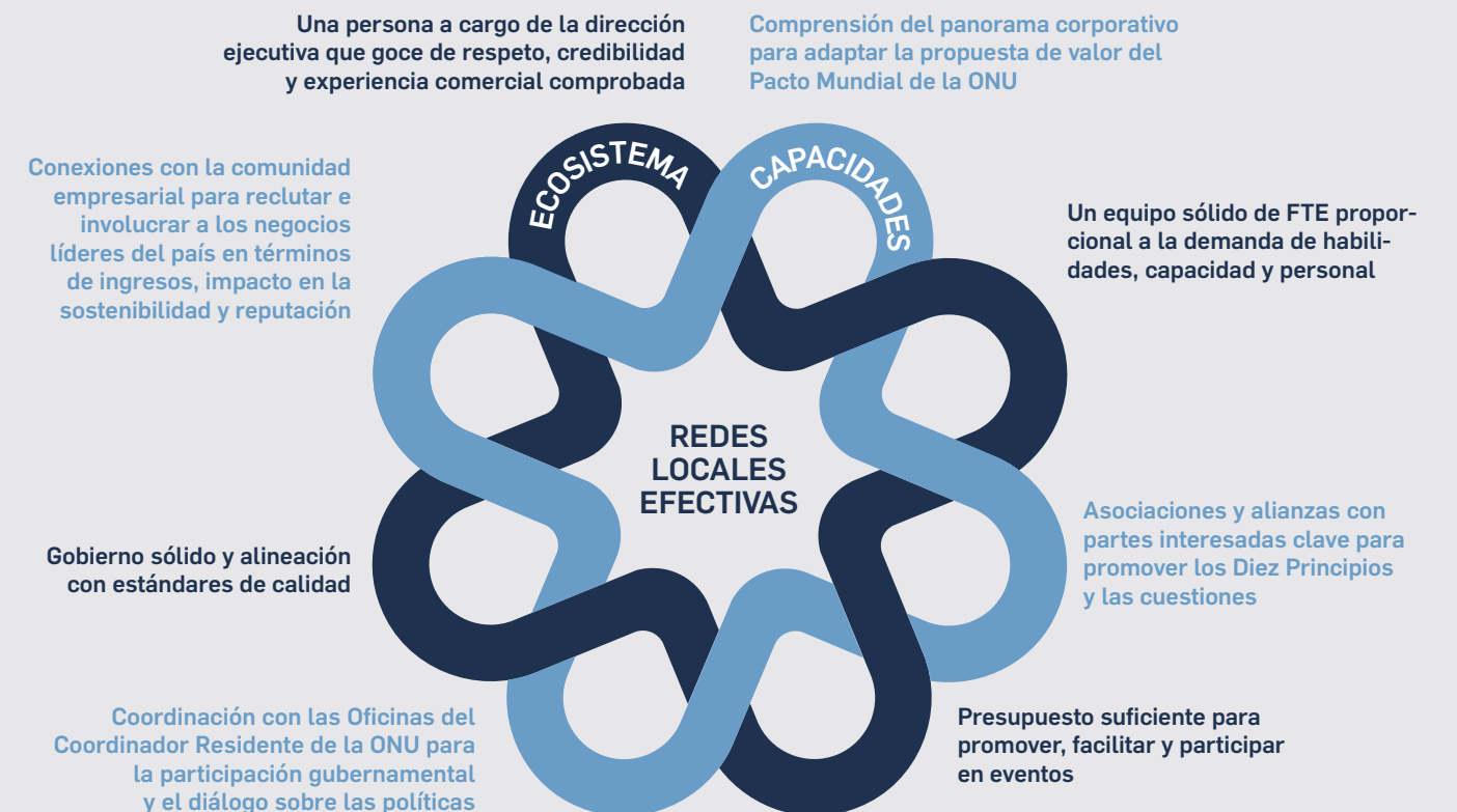
FIGURA 8: REDES LOCALES EXITOSAS: OCHO INGREDIENTES

La expansión de la huella del Pacto Mundial de la ONU aumentará la necesidad de más apoyo organizacional de la Oficina del Pacto Mundial de la ONU. Para permitir la fundación de nuevas Redes Locales y Regionales, un modelo operativo actualizado y regionalizado facilitará la entrega eficiente de contenido personalizado a los participantes del Pacto Mundial. El Pacto Mundial tiene tres Centros Regionales existentes en África, Medio Oriente y América Latina. Como parte de esta estrategia, abriremos dos Centros Regionales más para garantizar que nuestras Redes Locales cuenten con un apoyo completo y eficaz.