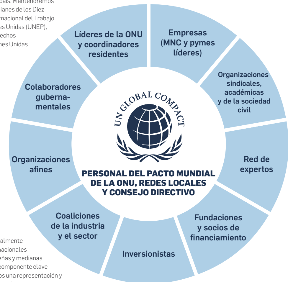
FIGURA 2: PARTES INTERESADAS CLAVE DEL PACTO MUNDIAL DE LA ONU

Nuestros participantes comprenden principalmente tres tipos de negocios: corporaciones multinacionales (MNC), empresas nacionales líderes y pequeñas y medianas empresas (PYME). Cada participante es un componente clave para el Pacto Mundial de la ONU y requerimos una representación y un compromiso sólidos de cada tipo para garantizar que tengamos el impacto global, colectivo y a escala que buscamos.