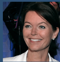
Lise Kingo. CEO y directora ejecutiva UN Global Compact

Hoy, el Pacto Mundial de las Naciones Unidas hace un llamamiento especial para dar una respuesta corporativa a la pandemia. Para que todas las empresas tomen medidas colectivas para frenar el brote de COVID-19 y se mantengan unidas para facilitar la continuidad de los negocios con el fin de una rápida recuperación.